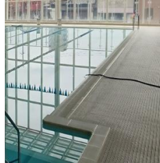
⑥プールサイド集合場所