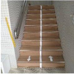
⑤3階から2階への階段