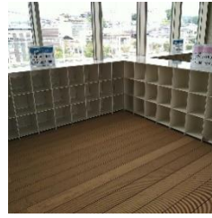
④教室用荷物置き場