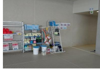
⑦更衣室へ繋がるプール出入口