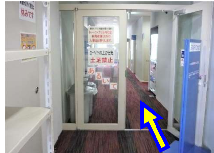
靴袋に靴を入れて入場

入場が一区切りしますと見学デッキ入口の扉が施錠されます。以降は2階から入退場します。