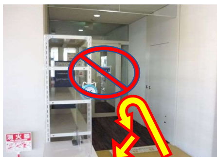
3Fが施錠されているときは2Fへ

入場が一区切りしますと見学デッキ入口の扉が施錠されます。以降は2階から入退場します。